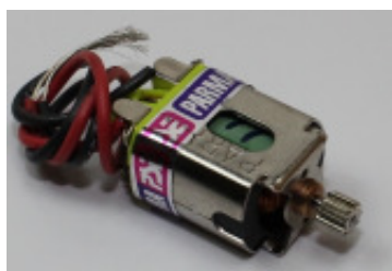
Parma S16D motor (forsegling ikke nødvendig)