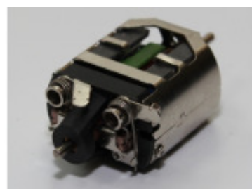
ProSlot S16D motor